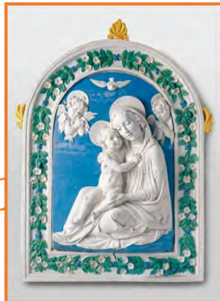
Luca Della Robbia (seconda metà del '400) Firenze, Museo del Bargello

Mi è capitato di leggere in un settimanale la cronaca rocambolesca del ritrovamento di una Madonna con il Bambino di Luca Della Robbia, sottratta nella notte del 9 agosto 1971 dalla chiesa di S. Giovanni Battista a Scansano. Grazie al prezioso lavoro del Nucleo tutela patrimonio culturale dei Carabinieri l'opera è stata ritrovata in Canada ed è ritornata in patria nel 2019.