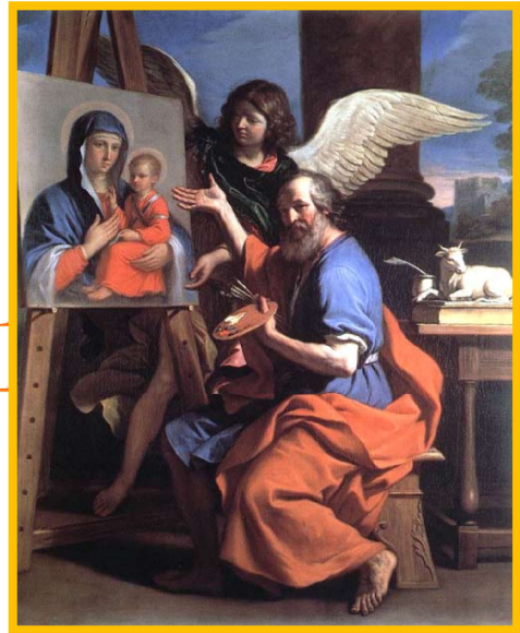
Giovanni Francesco Barbieri (Guercino) San Luca dipinge la Vergine 1652-53 Nelson – Atkins Museum of Art, Kansas City (Missouri, USA)

In questo notiziario abbiamo già trattato di come, nei primi secoli del cristianesimo, si veneravano molte icone della Vergine, tutte simili ad una immagine custodita gelosamente a Costantinopoli e attribuita al pennello di San Luca.